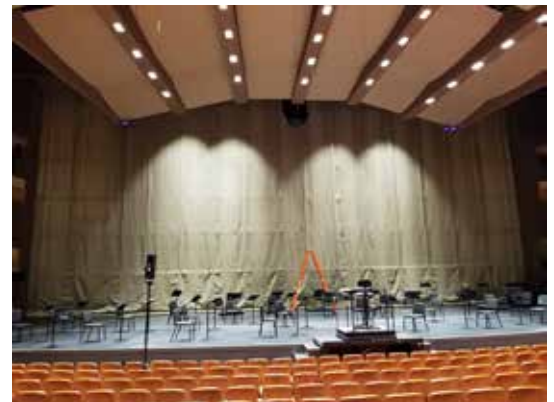
CENTER IN THE SQUARE - KITCHENER

Les rideaux coupe-feu respectent ou dépassent les normes suivantes :